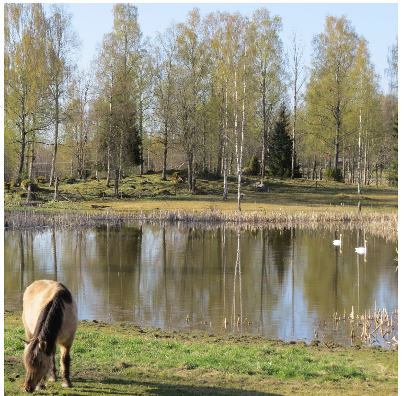
Våtmarken vid Laddrågen.

Andra +-värden är vatten till trädgården, skridsko på vintern.